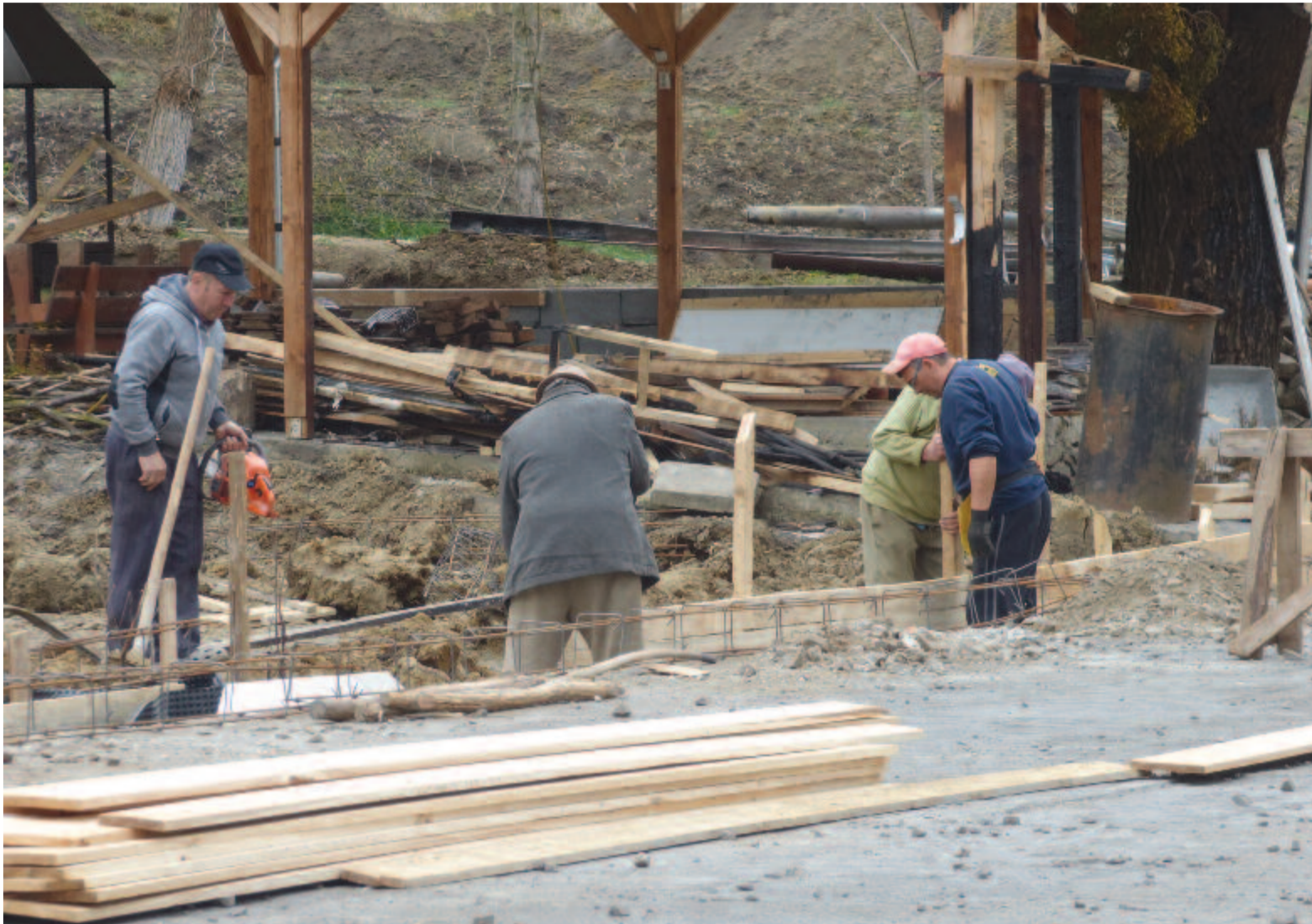
A pusztulás jelei eltűntek, elkezdődött az újjáépítés